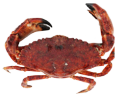
紅岩蟹 (Red rock crab)