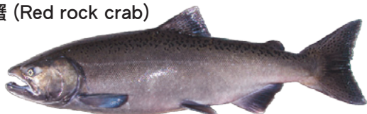
帝王三文魚 (Chinook Salmon) ♥